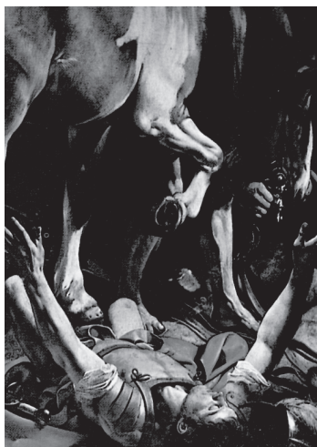
Karavadžo: Saula atgriešana

Pāvils (ap 10.–64. g.), kas no 45. līdz 58. g. devās tālos misijas ceļojumos uz Sīriju, Jeruzalemi, Dienvidanatoliju, Antiohiju, Maķedoniju un Grieķiju, tādējādi lielā mērā palīdzēdams izplatīt kristīgo priecās vēsti . Par parunu